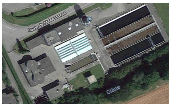
Avec la station d'épuration de Romont

Les STEP de Romont et Autigny doivent investir prochainement afin d'assainir leurs ouvrages, et augmenter leur capacité de traitement en raison du développement démographique et industriel des 15 communes membres.