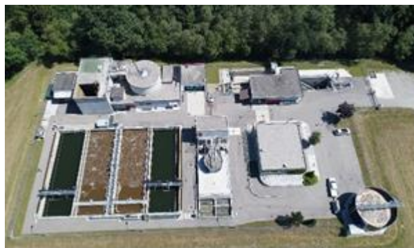
Avec la station d'épuration d'Autigny

Association intercommunale pour l'épuration des eaux du Moyen Pays de la Glâne et des Communes de la Paroisse de Sâles (AIMPGPS), regroupant 8 communes, après les fusions.